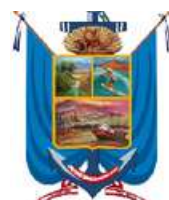
Municipalidad Distrital de Razuri